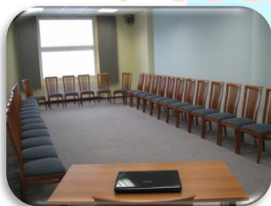
Do 35 oseb