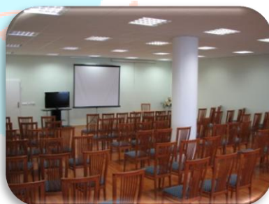
Do 125 oseb