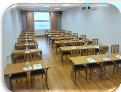
Do 42 oseb