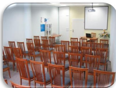
Do 52 oseb