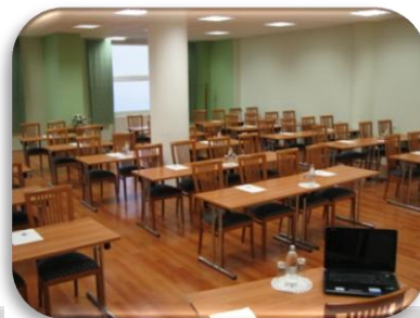
Do 72 oseb