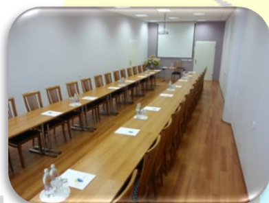
Do 34 oseb

Velikost dvorane je 60 M 2 in sprejme do 64 oseb.