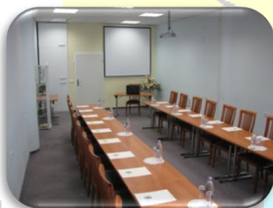
Do 25 oseb

Velikost dvorane je 50 M 2 in sprejme do 52 oseb.