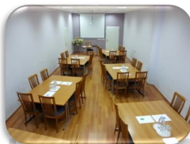
Do 36 oseb