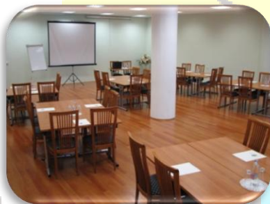
Do 42 oseb

Velikost dvorane je 130 m 2 in sprejme do 125 oseb.